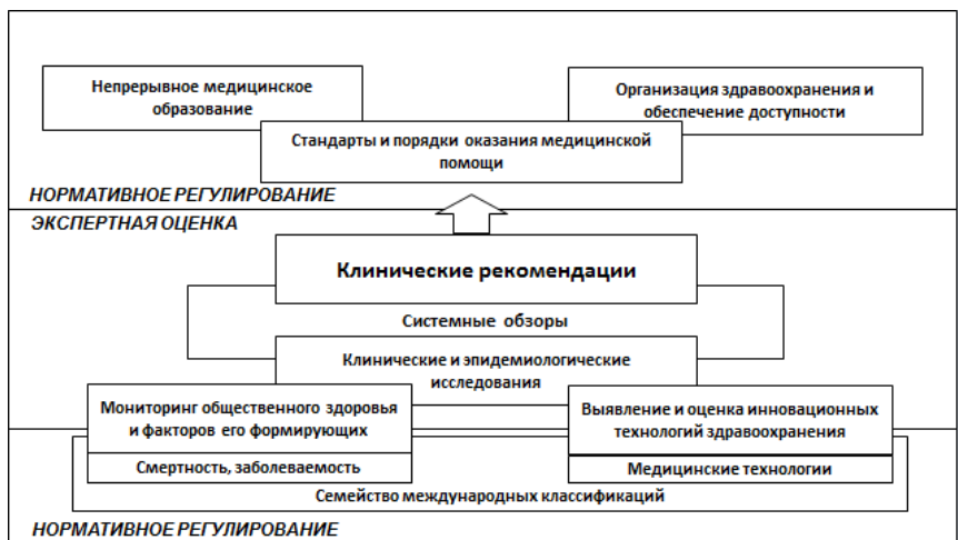
Рис. 3. Формирование данных для принятия решения при проактивном управлении рисками в здравоохранении.

Выводы. Проведенное исследование показало, на примере медицинской помощи онкологическим больным, что результативность этой помощи определяется не только существующими медицинскими технологиями, сколько эффективностью организации этой помощи и обеспечением ее доступности. Формирование доступности медицинской технологии для пациентов (наличие, экономическая доступность, приемлемость, информированность, восприятие, устранение административных барьеров) требует времени, поэтому единственно эффективным способом реализации положительных характеристик медицинской технологии является заблаговременное планирование объемов медицинской помощи, исходя из результатов мониторинга и прогноза как потребности в медицинской помощи, так и рынка медицинских технологий. Основой для эффективного мониторинга и прогноза общественного здоровья является использование корректной статистической информации на основе семейства международных классификаций, а основой для выбора наиболее эффективных медицинских технологий – клинические рекомендации на основе системного анализа и систематических обзоров.